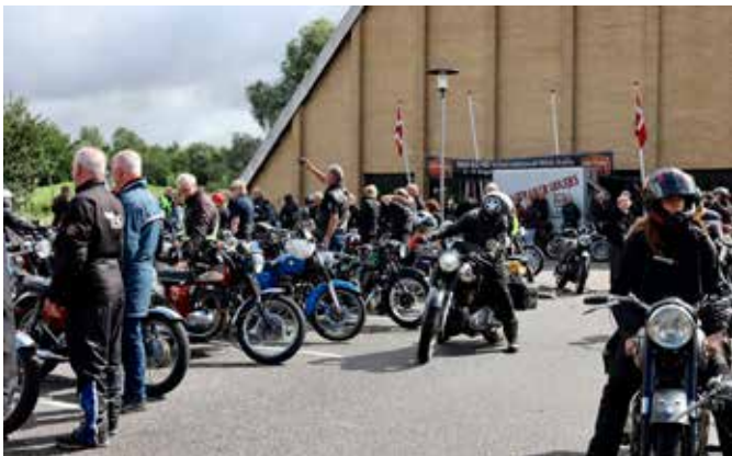
Start Line-up Tour