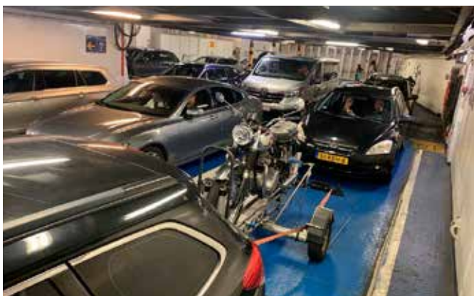
Fähre ab Puttgarden