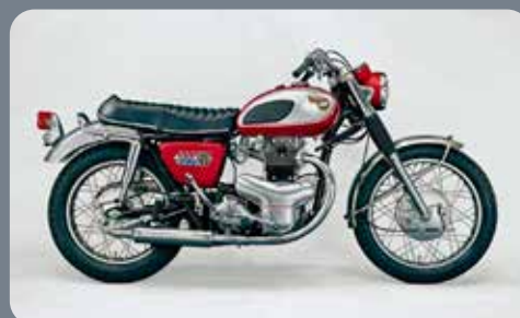
Kawasaki W1 SS 1966