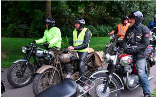
Lucas Night Run