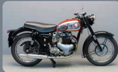
BSA A7 1962

Die A7 war die Basis der goldenen BSA-Ära und verkörperte den klassischen ‚Pre-Unit-Bau‘, bei dem Motor und Getriebe getrennt waren, eine gut erdachte Eigenart, die dem Mechaniker früherer Tage viel Freude bereitete.