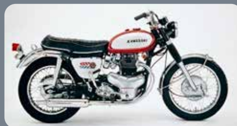
Kawasaki W2SS 1970