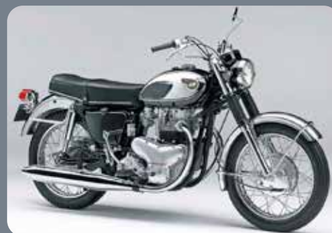
Kawasaki W1 1966