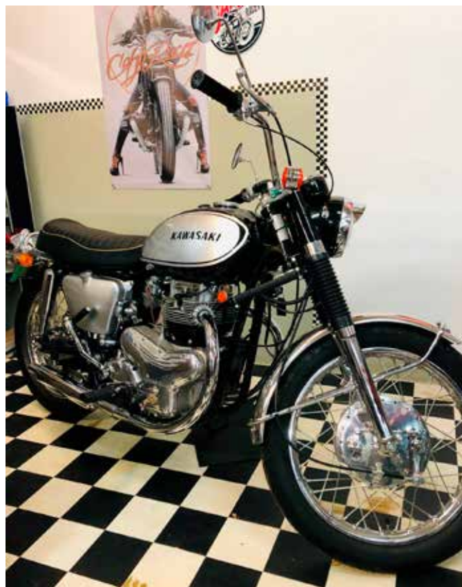
Meine Kawasaki W1 SS 1967