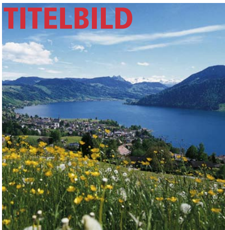
Blick auf den Aegerisee, wo im September unsere Jubi-Party steigen wird.

Homepage www.british.bikes.ch ist up-to date! Chrigel sei Dank!