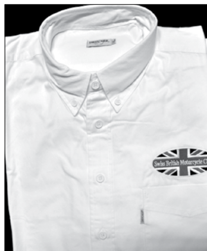
Kurzarmhemd weiss Fr. 20.- M, L, XL