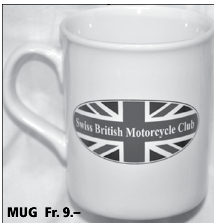
MUG Fr. 9.-