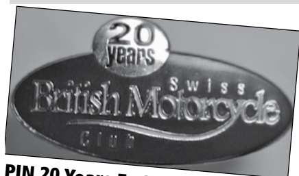
PIN 20 Years Fr. 2.-