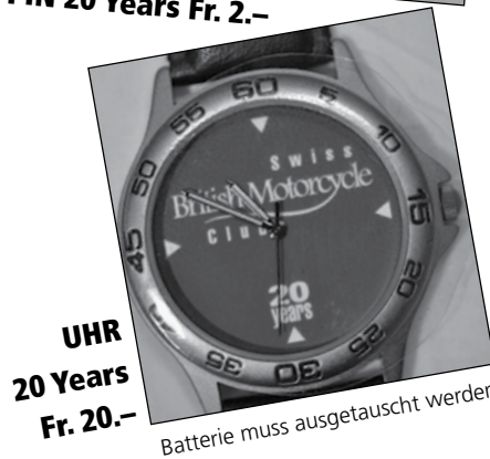
UHR 20 Years Fr. 20.-