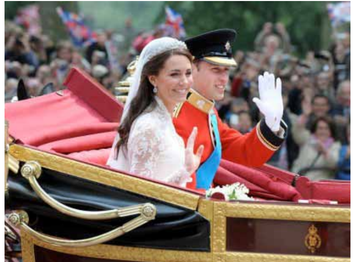
Royal Wedding NE 2011

Anscheinend hat Triumph die Gelegenheit verpasst – sorry – verpasst, die königliche Hochzeit im Hause Windsor als Anlass für eine Limited Edition zu nutzen; oder passen solche Ereignisse auch einfach nicht mehr ins „Hinckley-Konzept“. Ok, vielleicht konnte man die Designer nicht auch noch damit belasten, die sind ja sicher schon wieder mit einem „Redesign“ des Triumph-Logos beschäftigt. Nr. wieviel ? in mal knapp 20 Jahren. Schade, eigentlich hätte doch mal wieder etwas spezielles entstehen können. Ich habe mich jedenfalls mal kurz hingesezt, die Phantasie fliegen gelassen und einer Speedy zu etwas mehr Pop – äh – Pep verholfen. Um es noch zu betonen: die Royal Wedding NE2011 (NE steht für No Edition) ist bei Triumph NICHT erhältlich.