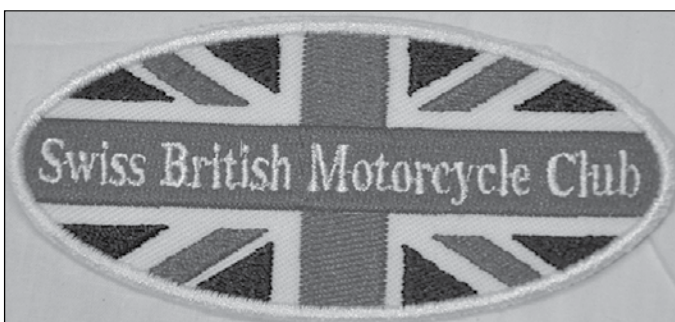
Aufnäher Fr. 8.-