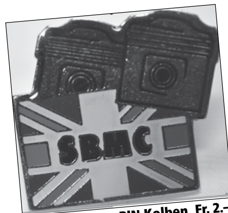
PIN Kolben Fr. 2.-